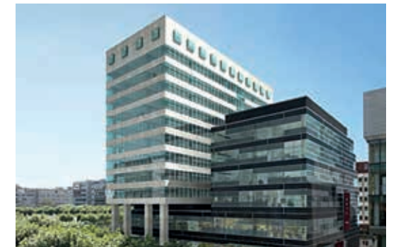
Bienenkorbhaus, Zeil, Frankfurt am Main