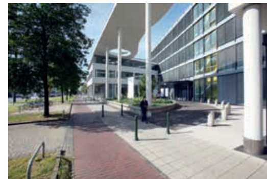
CPO-Central Park Offices, Düsseldorf