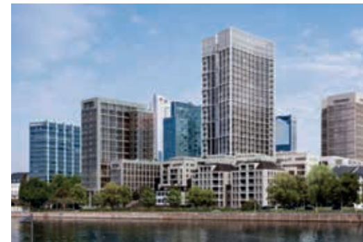
MainTor – The Riverside Financial District, Frankfurt am Main