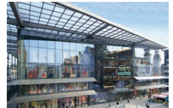
Kaufhof, Chemnitz und Bremen