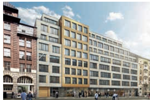
Opera Offices, Hamburg