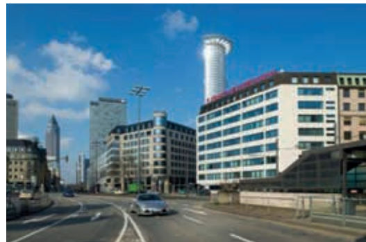
Am Hauptbahnhof, Frankfurt am Main

Das bundesweite Engagement der DIC baute eines der größten Gewerbeimmobilien-Portfolios in Deutschland auf. Hier eine Auswahl der erworbenen Objekte und realisierten Projekte.